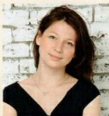
Автор проекта: архитектор Дина Салахова (г. Москва)

«Всегда следую простому правилу древнеримского архитектора: польза, прочность, красота. Данные понятия — основа всей архитектуры»